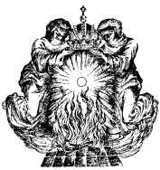
DE VERERING VAN HET H. MIRAKEL VAN AMSTERDAM